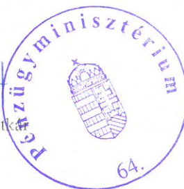
Oláh Gábor helyettes államtitkár